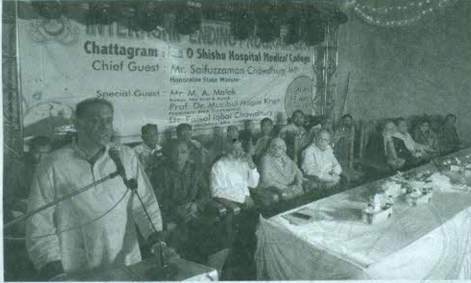
চট্টগ্রাম মা ও শিশু হাসপাতাল মেডিকেল কলেজের ইন্টার্নী ডাক্তারদের সমাপনী অনুষ্ঠানে বক্তব্য রাখছেন মাননীয় ভূমি প্রতিমন্ত্রী জনাব মোঃ সাইফুজ্জামান চৌধুরী, এমপি।