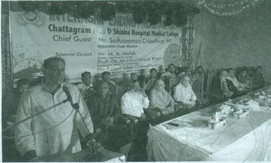
চট্টগ্রাম মা ও শিশু হাসপাতাল মেডিকেল কলেজের ইন্টার্নী ডাক্তারদের সমাপনী অনুষ্ঠানে বক্তব্য রাখছেন মাননীয় ভূমি প্রতিমন্ত্রী জনাব মোঃ সাইফুজ্জামান চৌধুরী, এমপি।